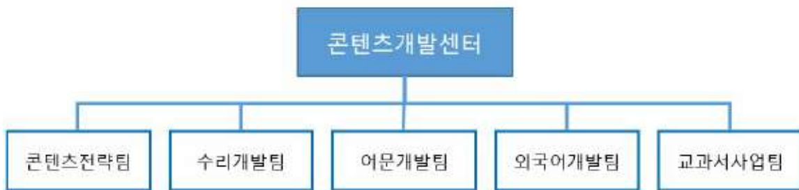
대교 콘텐츠개발센터 조직도

보고서 작성 기준일 현재 (주)대교 콘텐츠개발센터의 조직도는 아래와 같습니다.